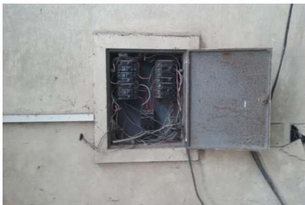
Figura 04. Infraestrutura precária da instalação de guarda dos bens inservíveis

Uma terceira visita a DIAP/SINFRA, no dia 26 de outubro de 2016, reforçou a identificação das dificuldades relativas à gestão dos bens inservíveis da UFAL, e em especial o processo crítico de desfazimento. Uma mostra dos problemas enfrentados pela Divisão de Almoarifado e Patrimônio pode ser visualizada a partir das Figuras 04, 05, 06 e 07, que retratam as instalações e condições de guarda dos bens inservíveis da UFAL.