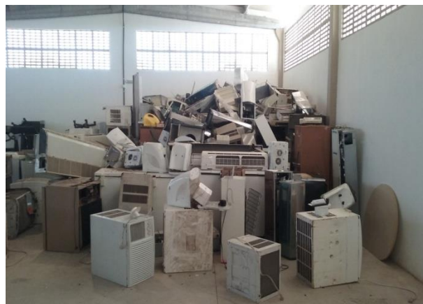
Figura 07. Condições de guarda de bens inservíveis