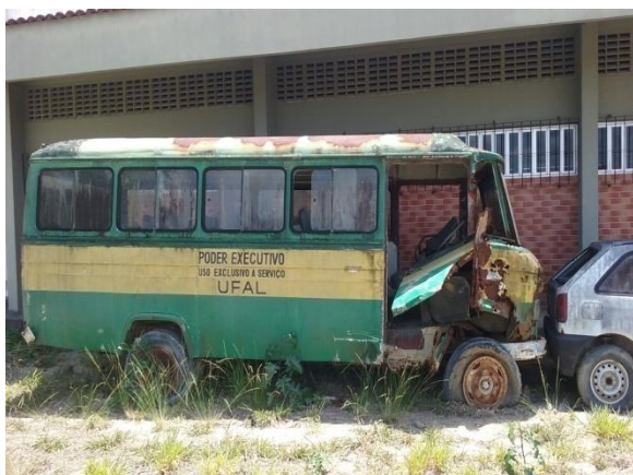
Figura 06. Condição de guarda e estado de bem inservível – primeiro ônibus da UFAL