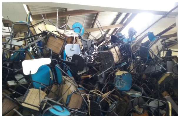
Figura 05. Condições de guarda dos bens inservíveis