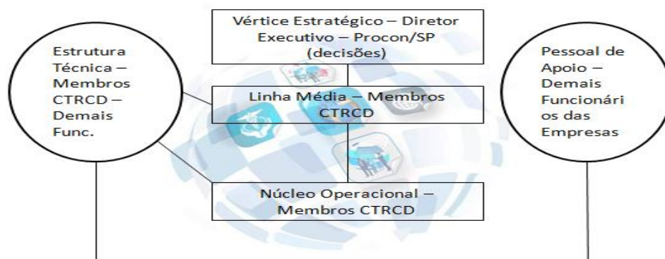
Figura 3: Organograma da Câmara Técnica de Relações de Consumo do Desporto do PROCON SP