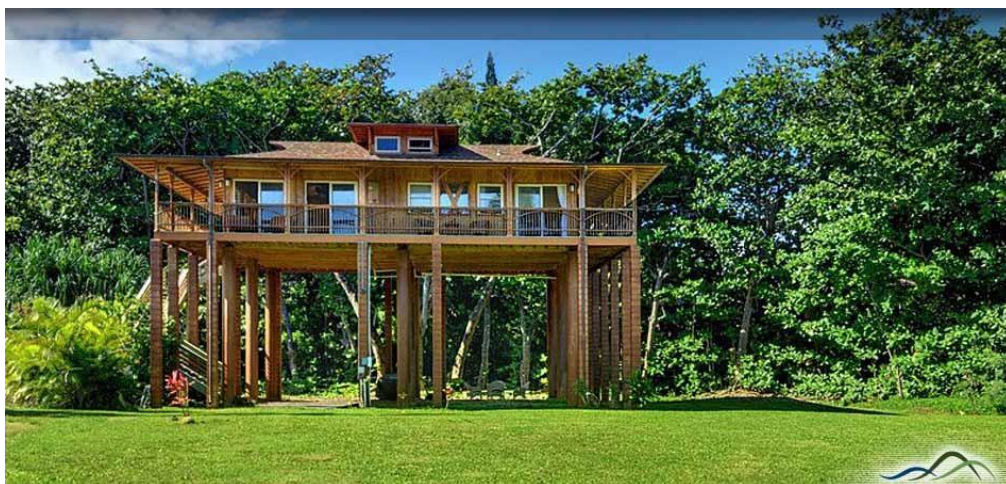
Figura 1: Casa de bambu.

Nesse sentido, essa construção apresenta vários benefícios ambientais além de agregar valor tecnológico. O bambu é considerado um excelente isolante térmico e acústico. Ver figura 1.