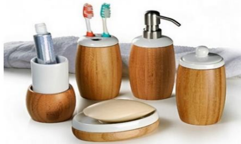
Figura 4. Utensílios para banheiro