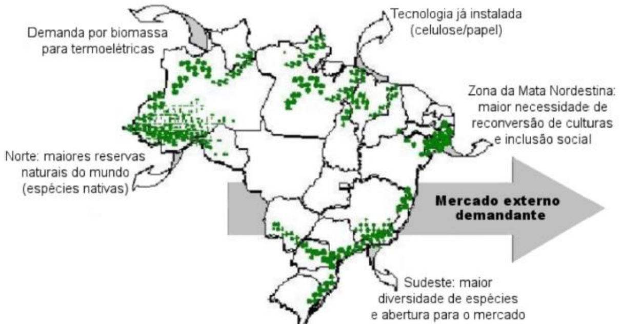
Figura 6 – distribuição geográfica do bambu no Brasil – fora de escala (Fonte: FIALHO et al., 2005).

Ao se estudar uma cadeia produtiva, observa-se a inter-relação de todas as fases do processo industrial. Neste aspecto e entre as considerações finais desta pesquisa também pode-se concluir que foi alcançada uma maior percepção do papel do designer quando abordada a questão do desenvolvimento sustentável. Percebesse que este profissional também deve compreender todos os segmentos de uma cadeia produtiva para que sejam previstas as consequências sociais, ambientais e econômicas de um projeto de produto industrial. Pela questão de a sustentabilidade estar cada vez mais valorizada nas universidades, na sociedade e no mercado como um todo, estas experiências individuais poderão futuramente incorporar-se à sistematização das cadeias produtivas com base no bambu.