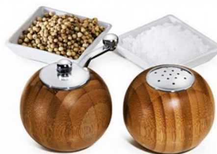
Figura 3. Porta tempero de bambu